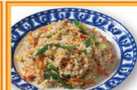
インドチャーハン ¥800 Indian Fried Rice

セットのナンは プラス¥230で チーズナン プラス¥130で ガーリックナン・ゴマナン に変更できます