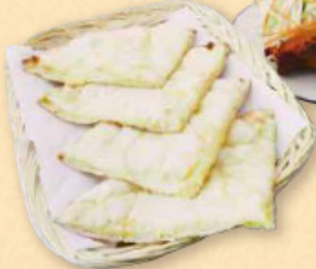
ドライセット Dry set タンドールチキン(1本) チーズナン(1枚) サラダ ¥1,150