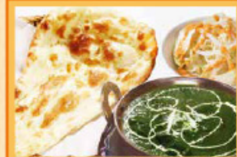
赤ウレン草チキンカレーセット ナンまたはライス・サラダ Sag Chicken Curry, Nan or Rice, Salad ¥990