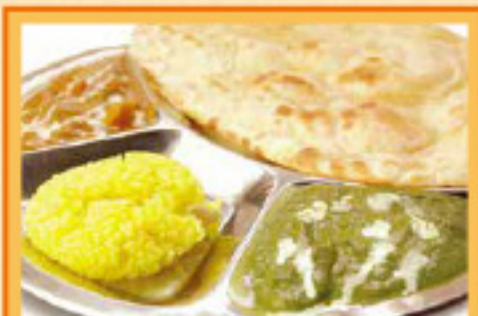
サービスランチセット ナン・バターライス・サラダ 2 Curry, Nan, Butter Rice, Salad ¥990