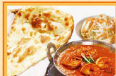
玉ビカレーセット ナンまたはライス・サラダ・ドリンク Drawn Curry, Nan or Rice, Salad, Drink ¥1,090