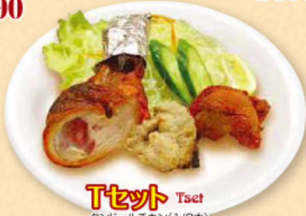
Tセット Tset タンドールチキン(1/2本) チキンティッカ(1個) ムルグマライ(1個) 各 ¥700