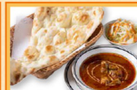
シーフードカレーセット ナンまたはライス・サラダ・ドリンク Seafood Curry, Nan or Rice, Salad, Drink ¥1,390