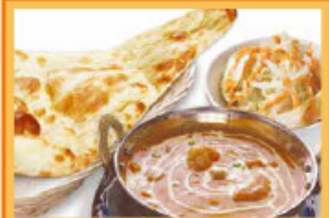
王様ランチセット(チキンカレー) ナンまたはライス・サラダ Chicken Curry, Nan or Rice, Salad ¥880