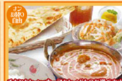
スペシャルセット ¥1,300 チキンカレーorキーマカレーどちらか選べます ナンまたはライス・サラダ・デザート・ドリンク Curry, Nan or Rice, Salad, Dessert, Drink