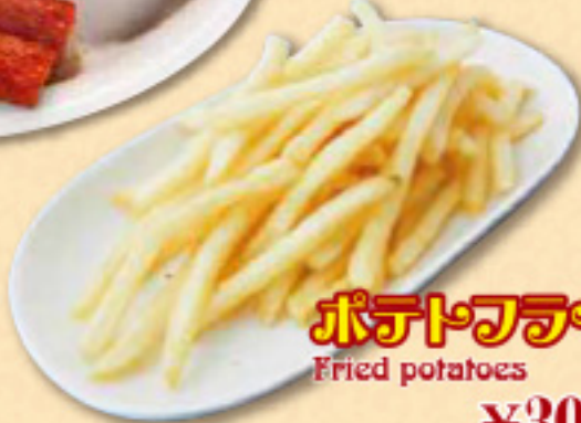
ポテトフライ Fried potatoes ¥300