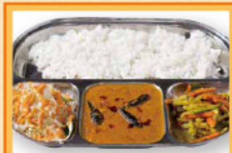
ネパールダルバット ¥950 サラダ・豆カレー・漬物・ライスのセット Nepal Dal Bat