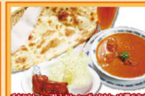
ガンジーセット ¥1,490 チキンティッカ2P・サラダ・ドリンク 2 Curry, Nan or Rice, Salad, Drink