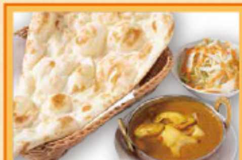
チキンドピアザセット ナンまたはライス・サラダ・ドリンク Chicken Dopiaza, Nan or Rice, Salad, Drink ¥1,050