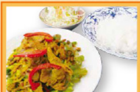
スパイシーポークセット ¥990 ナンまたはライス・サラダ Spicy pork set, Nan or Rice, Salad