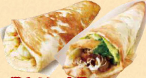
巻きナン・肉巻きナン Rolling Ran Meatrolling Ran 各 ¥690