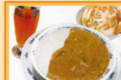
カレーライスセット ¥890 サラダ・ドリンク Curry Rice, Salad, Drink