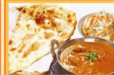
ポークカレーセット ナンまたはライス・サラダ Deek Curry, Nan or Rice, Salad ¥990