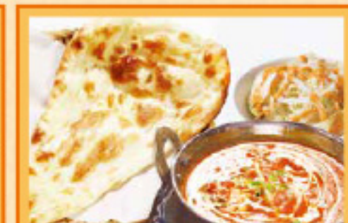
バターチキンカレーセット ナンまたはライス・サラダ・ドリンク Butter Chicken Curry, Nan or Rice, Salad, Drink ¥1,300