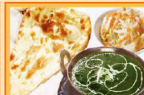
エビとハウレン草カレーセット ナンまたはライス・サラダ・ドリンク Sag Drawn Curry, Nan or Rice, Salad, Drink ¥1,300