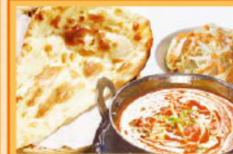
ナバラタンカレー(野菜)セット ナンまたはライス・サラダ Navathan Curry, Nan or Rice, Salad ¥990