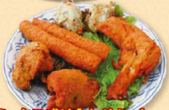
ミックス盛り合わせセット Mix assortment set チキンティッカ(2個) ムルグマライ(2個) シーカバブ(2個) タンドールチキン(1本) ¥1,990