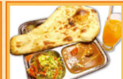
チャイルドセット ¥800 カレー・ナン・サラダ・ドリンク・デザート Curry, Nan, Salad, Drink, Dessert