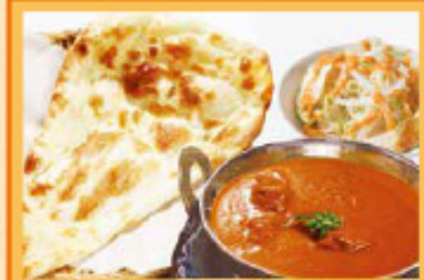
マトンカレーセット ナンまたはライス・サラダ Mutton Curry, Nan or Rice, Salad ¥990