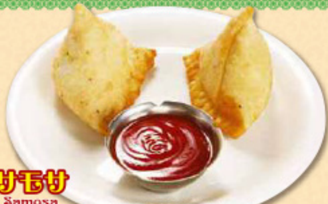
サモサ Samosa 2個 ¥500 各種香辛料を野菜で仕上げたインド風春巻き