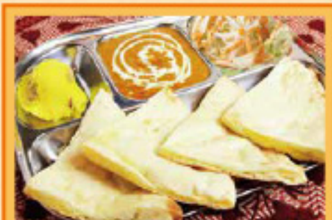
チーズナンセット チーズナン・バターライス・サラダ・ドリンク 1 Curry, Cheese Nan, Butter Rice, Salad, Drink ¥1,100