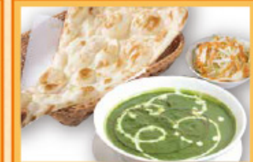
ハウレン草とポークカレーセット ナンまたはライス・サラダ Sag Pork and Curry, Nan or Rice, Salad ¥1,050