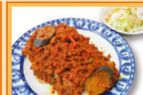
キーマドライカレー ¥990 サラダ Feema curried pilaf, Salad キーマドライカレー・ハーフ ¥600