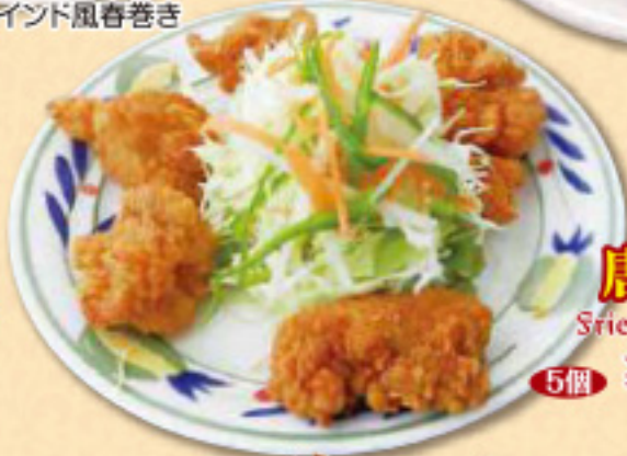
唐揚げ Fried chicken 5個 ¥490