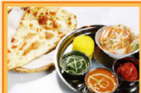
スペシャルサービスセット ナンまたはライス・サラダ・チキンティッカ・ドリンク Chicken Curry and Sag Chicken Curry, Nan or Rice, Salad, Chicken Tikka, Drink ¥1,390