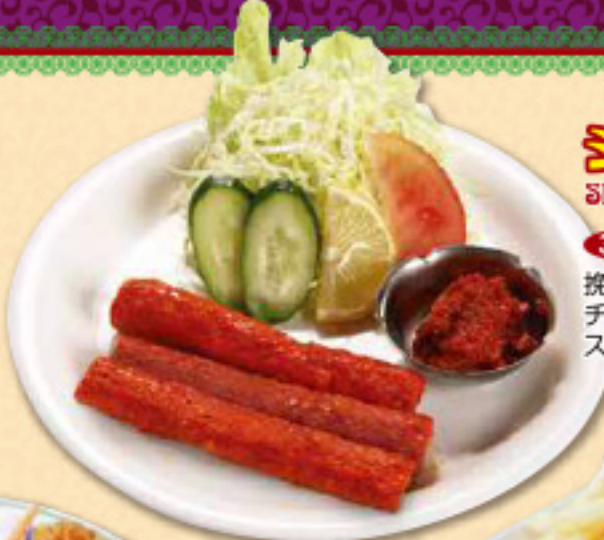
シーカバブ Sheek Kabab 3本 ¥900 挽肉にした羊肉と少量のチキン入り スパイスバーベキュー